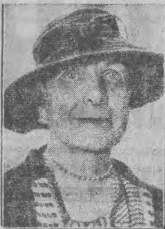
FLORENCE JAFFRAY HARRIMAN

liczy bowiem dziś 67 lat. W jej obecnym stadium pracy stoi ona bowiem nie na początku swojej kariery politycznej, lecz u jej zenitu. W napisanej przez panią Harriman książce p. t.: „Od pianina do polityki”, opowiedziała ona koleje swego życia. Jest to kariera milionerki,