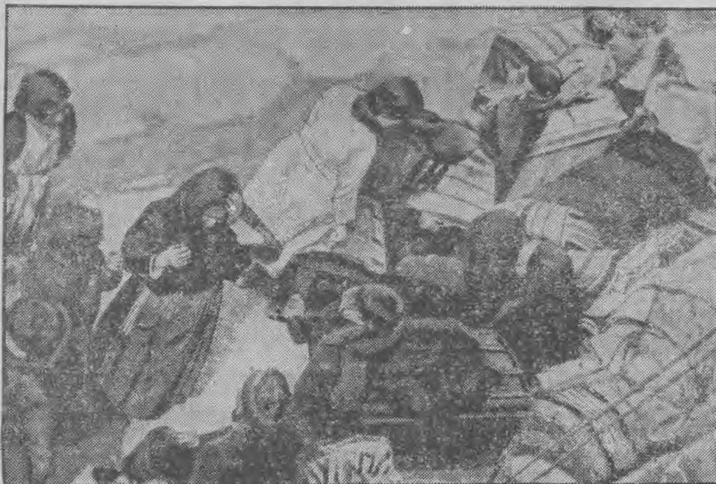
Uciekinierzy z Hiszpanii masowo przekraczają granicę francuską.

8 samolotów powstańczych latało dziś nad Madrytem, lecz artyleria przeciwlotnicza zmusiła je do wycofania się.