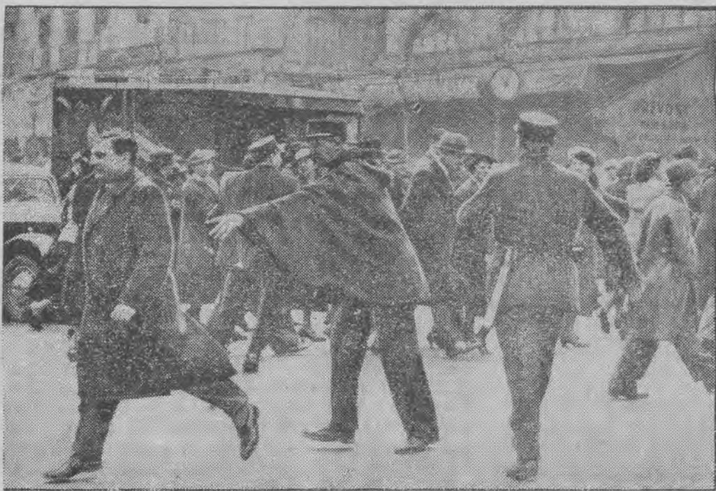
policja występuje przeciwko pracownikom domów towarowych, demonstrujących na rzecz 40-godzinnego tygodnia pracy.