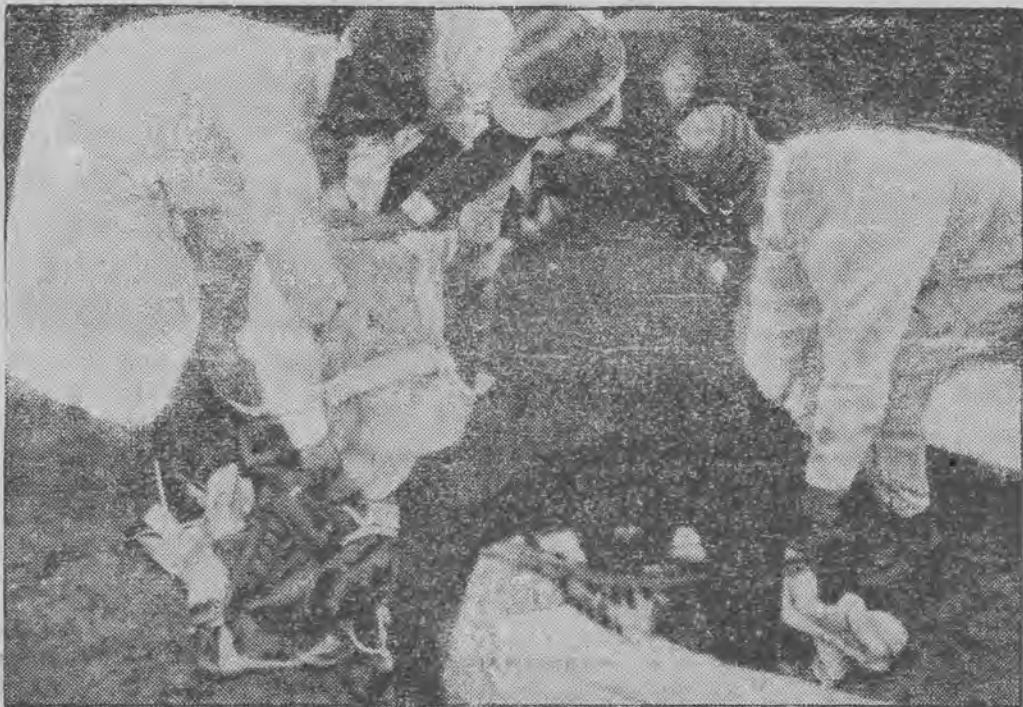
Wszelki ratunek okazał się spóźniony. „Człowiek - ptak” przypłacił życiem moment zetknięcia się z ziemią.