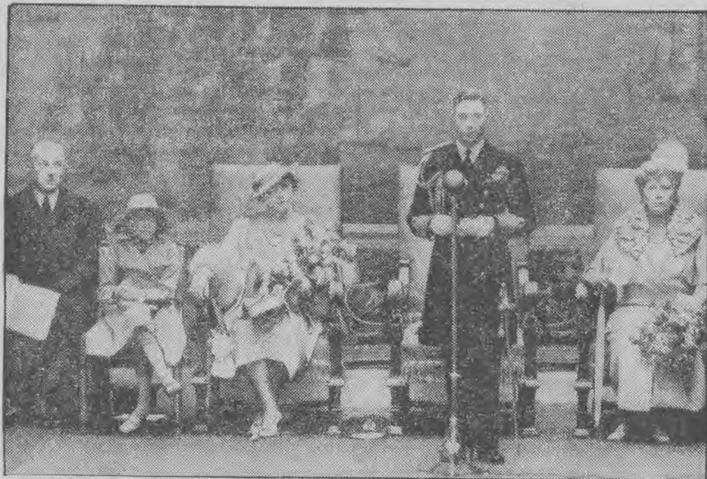
Król otworzył w Greenwich National Maritime Museum, pierwsze tego rodzaju muzeum w Wielkiej Brytanii. Na prawo od króla widzimy królową matkę Mary, na lewo królowa Elżbieta, księżniczka Elżbieta i pierwszy lord admiralicji.