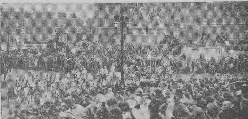
Powóz koronacyjny opuszcza w czasie generalnej próby koronacji pałac Buckingham aby przejechać całą trasę, jaką odbędzie w dniu dzisiejszym.