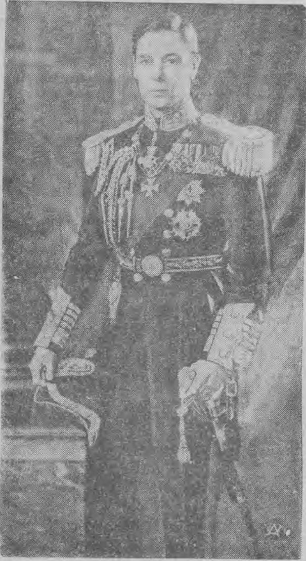
Król Jerzy VI w galowym mundurze.