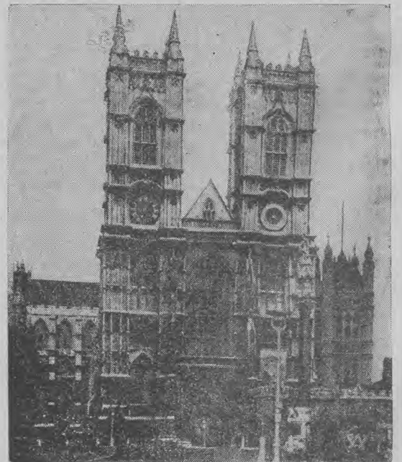
Opactwo Westminsterskie, w którego murach odbędzie się uroczysta koronacja.