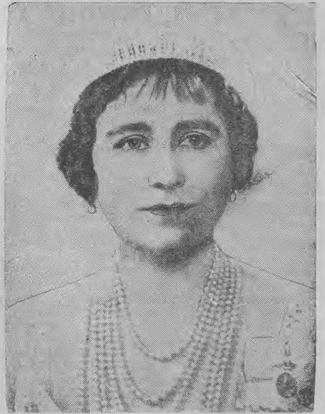
Królowa Anglii Elżbieta.