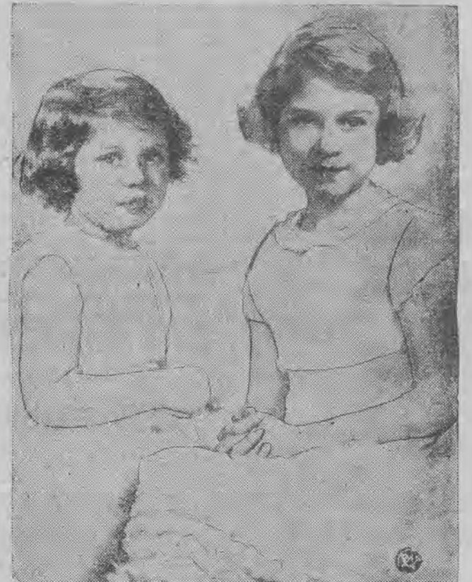
Przypuszczalna następczyni tronu, ks. Elżbieta wraz z młodszą siostrą ks. Małgorzatą Różą.