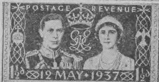
Angielskie znaczki koronacyjne wypuszczone przez pocztę z okazji koronacji królewskiej w serii pół, 1, 1 i pół i 2 i pół pensów, wyobrażają parę królewską i króla Jerzego VI z profilu.