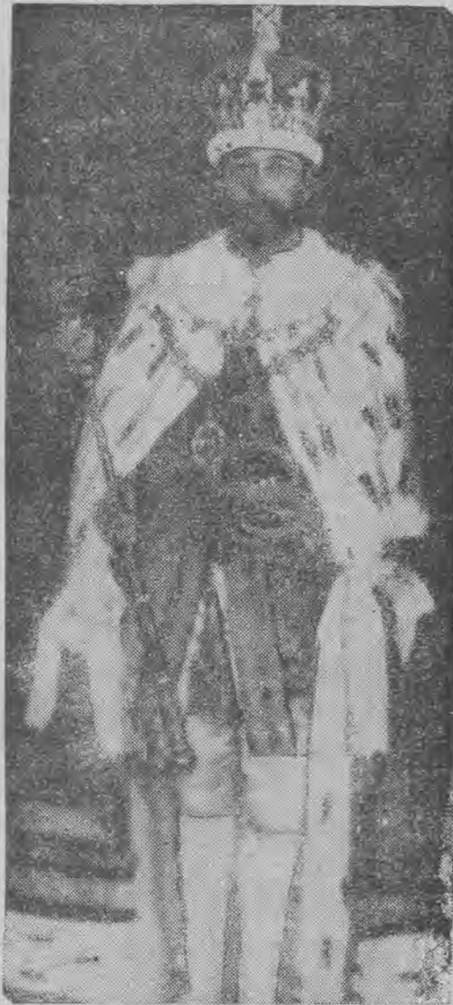
Ojciec króla Jerzego VI, Jerzy V. w uroczystym stroju koronacyjnym z insygniami koronacyjnymi.