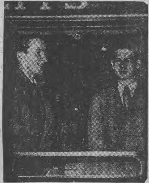
Arcyksiążę rumuński Michał, który reprezentował swój kraj na uroczystościach koronacyjnych.

BERLIN, 13.5. (PAT) — Dziś ścięci zostali w Berlinie dwaj osobnicy. Jeden z nich oskarżony był o zbrojny opór policji, a drugi o zamordowanie żony z chęci zysku.