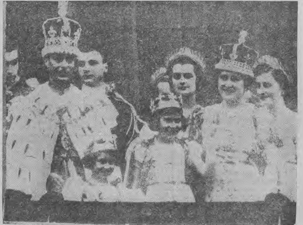
Zdjęcie przedstawia króla Jerzego VI w towarzystwie królowej Elżbiety oraz córek królewskich: przypuszczalnej następczyni tronu ks. Elżbiety i ks. Małgorzaty Róży, po koronacji pary królewskiej w opactwie westminsterskim.