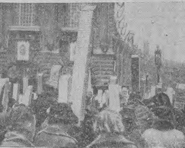
Las peryskopów, który umożliwił stojącym w dalszych rzędach obejrzenie wszystkich wspaniałości pochodu koronacyjnego