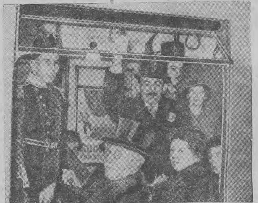
Parowie Anglii i deputowani udają się koleją podziemną do opactwa westminsterskiego na koronację.

Rewelacyjny film muzyczny, o którym mówi cały świat!