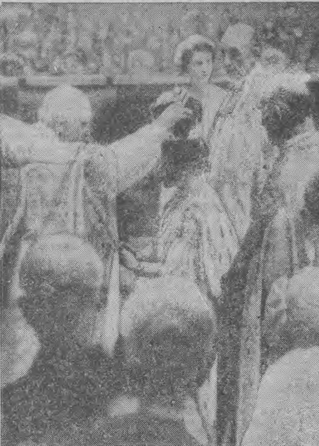
Biskup Canterbury wkłada królowej Elżbiecie koronę na skronie.