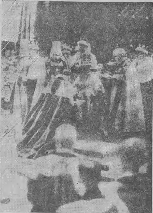
Moment hołdu składanego królowi Jerzemu VI przez parów Anglii bezpośrednio po akcie koronacji.