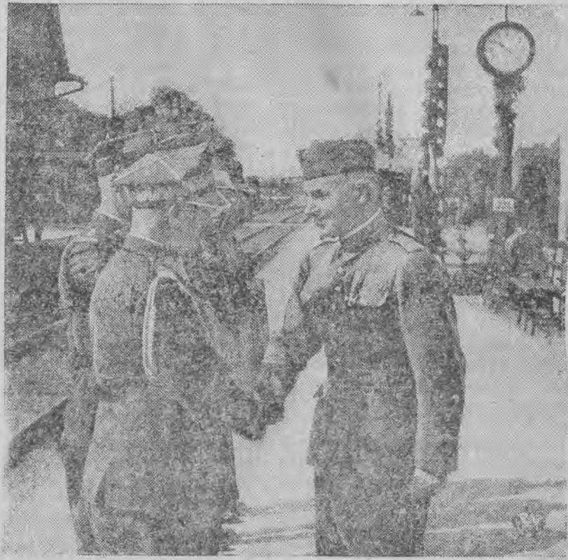
Na terenie wielkich manewrów armii polskiej bawił Marszałek Śmigły - Rydz. Zdjęcie przedstawia p. Marszałka, witającego się z p. ministrem spraw wojskowych gen. Kasprzyckim.

Wódz Naczelnny uśmiechem dziękował dzielnym piechurom za ich dziarską postawę. W