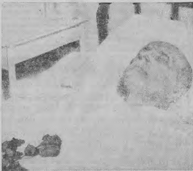
na zamku swoim Lana pod Pragę.