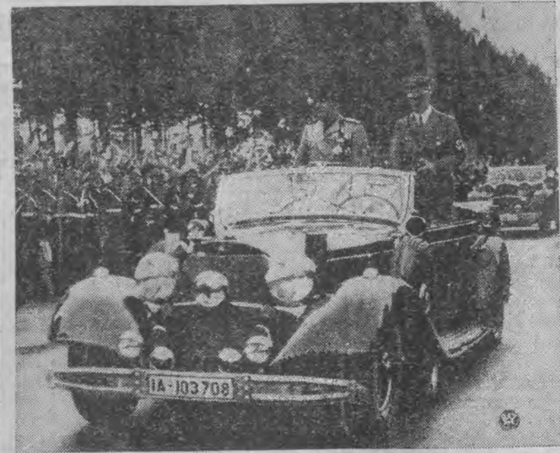
Zdjęcie nasze przedstawia Hitlera i Mussoliniego w drodze na manifestację na Malfeldzie.

„Czarne koszule, przynoszę z Niemiec i z moich rozmów, przeprowadzonych z Führerem głębokie wrażenie i niezatarte