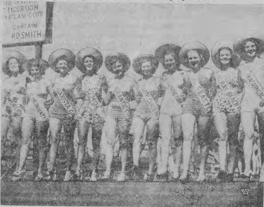
Na zdjęciu naszym uroczyste uczestniczki konkursu o tytuł Miss Ameryka, który odbył się w Atlantic-City