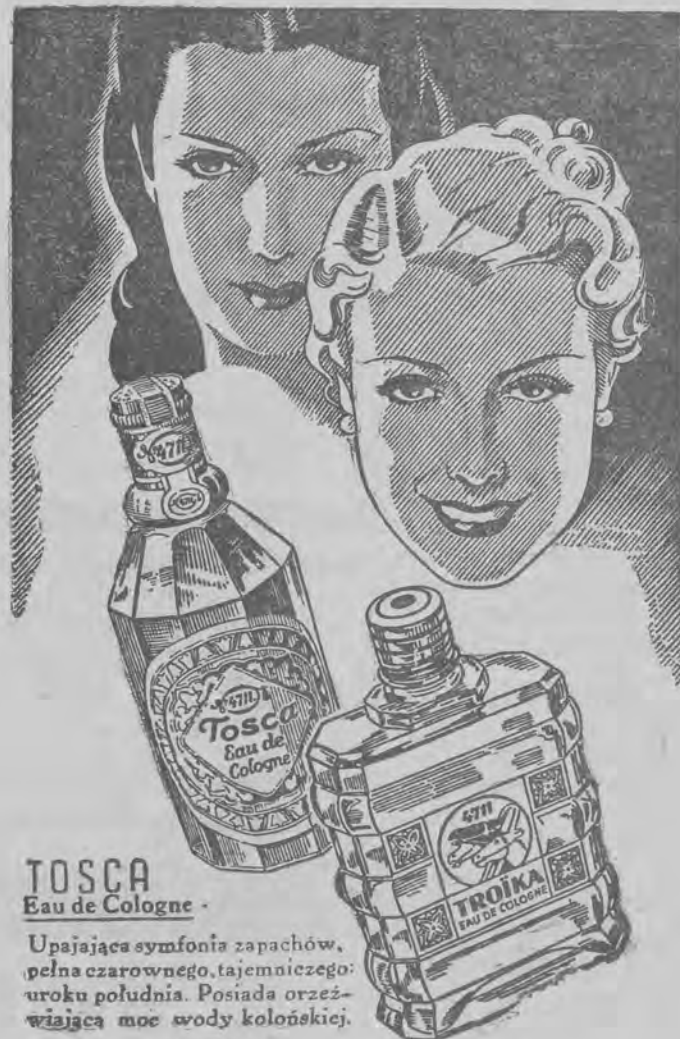
TOSCA Eau de Cologne

Upajająca symfonia zapachów, pełna czarownego, tajemniczego uroku południa. Posiada orzeźwiająca moc wody kolońskiej.