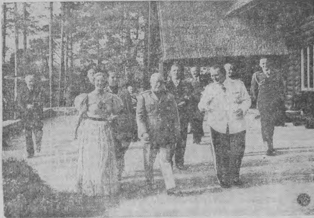
Mussolini u premiera pruskiego Goeringa i jego małżonki w myśliwskiej rezydencji Goeringa t. zw. Karinhall. Mussolini wraz z min. Ciano przechadza się w towarzystwie pp. Goeringów po parku podczas popołudniowego przyjęcia.