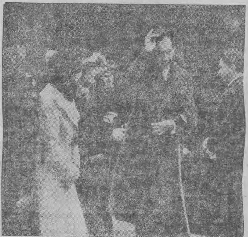
Zdjęcie nasze przedstawia p. min. Becka w otoczeniu witających go urzędników M. S. Z. oraz w towarzystwie małżonki i córki na dworcu kolejowym w Warszawie.