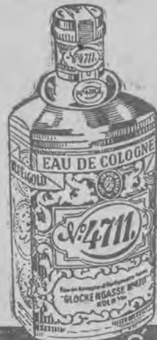
KLASYCZNA Eau de Cologne

Towarzyszka miłośniczek sportu, rasowa, młodzieńczo rzeźba i czarująca nowoczesna o nie zastąpionej mocy orzeźwiająca.