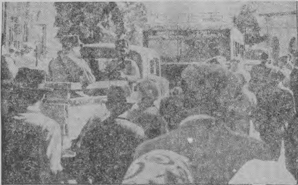
Uzbrojone patrole na ulicach Tel-Awiwu.

JEROZOLIMA, 15.11. (ŻAT) — Z dobrze poinformowanego źródła ŻAT-na dowiaduje się, że naczelny dowódca brytyjskich sił zbrojnych w Palestynie generał Wavell przygotowuje szereg zarządzeń wyjątkowych, m. in. zakaz przybywania do Palestyny obywateli państw obcych.