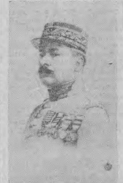
Gen. Bilotte następcą jednorekiego gen. Gouraud.

z żoną, stale przebywał poza domem w towarzystwie coraz to innej kobiety.