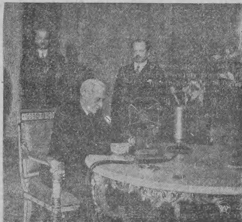
Pan Prezydent przed mikrofonem radiowym

Nie od rzeczy będzie zaznaczyć, że w interesie graczy leży, możliwie jaknajwcześniejsze zwrócenie się o informacje do Dyrekcji, po upewnieniu się, że kolektor danego numeru nie posiada, aby odpowiedź otrzymać na czas.