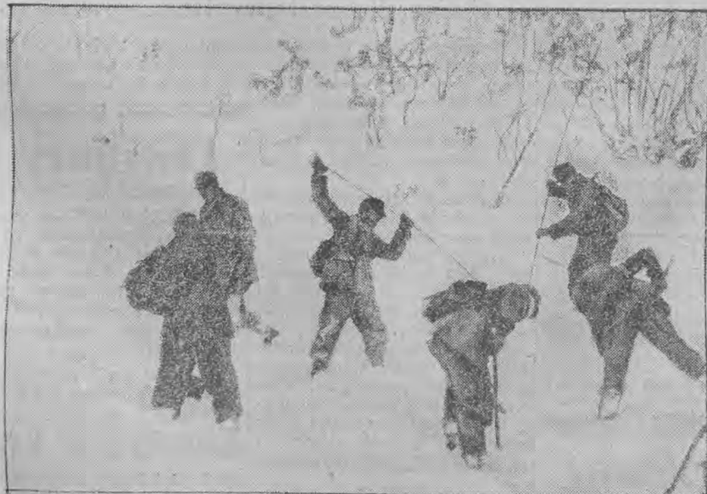
poszukuje gorączkowo turystów, których zasypała lawina w górach Austrii