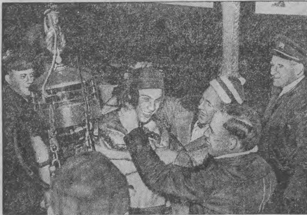
ustanowił nowy rekord światowy, opuszczając się do głębokości 130 metrów na dno jeziora Michigan