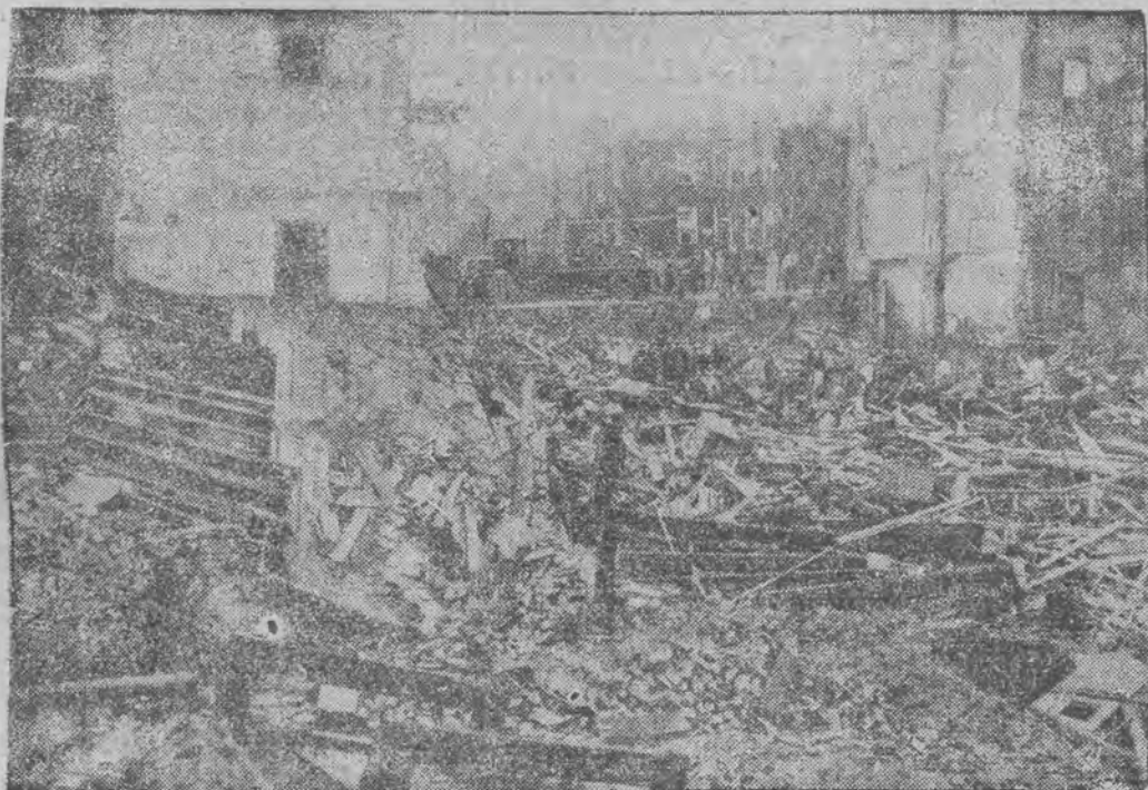
Tak wyglądają przedmięcia Teruelu po ostatnich zaciętych bojach

Wszystko pozwala przypuszczać, że rozpoczęła się nowa faza bitwy pod Teruelem, polegająca na wojnie manewrowej, w której sztaby obu stron będą miały sposobność wykazać swych zdolności.