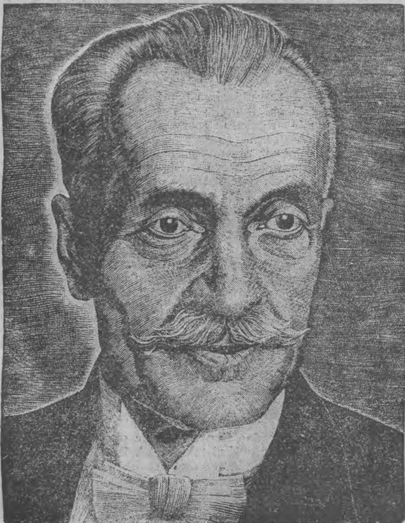
Pan Prezydent Rzeczypospolitej prof. dr. Ignacy Mościcki święci dziś dzień Swoich Imienin