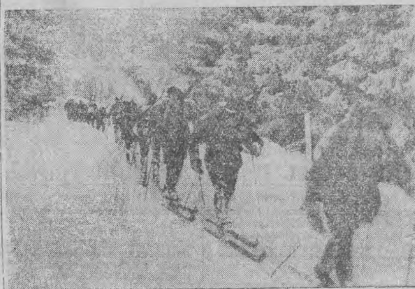
podczas biegu długodystansowego na manewrach przy Mont Revard.