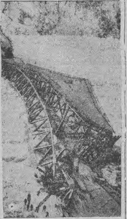
który łączył Stany Zjednoczone z Kanadą.