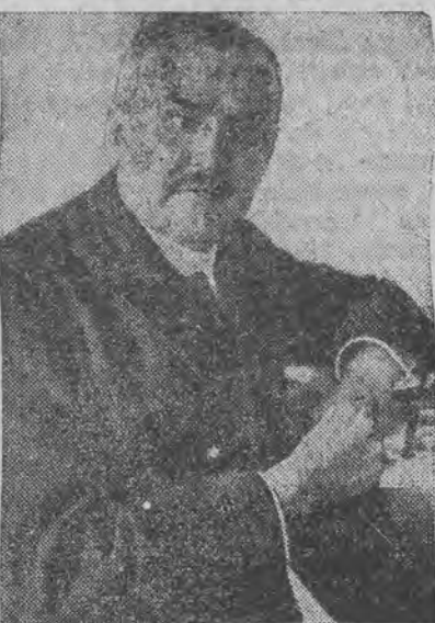
zmarły wielokrotny premier i minister.