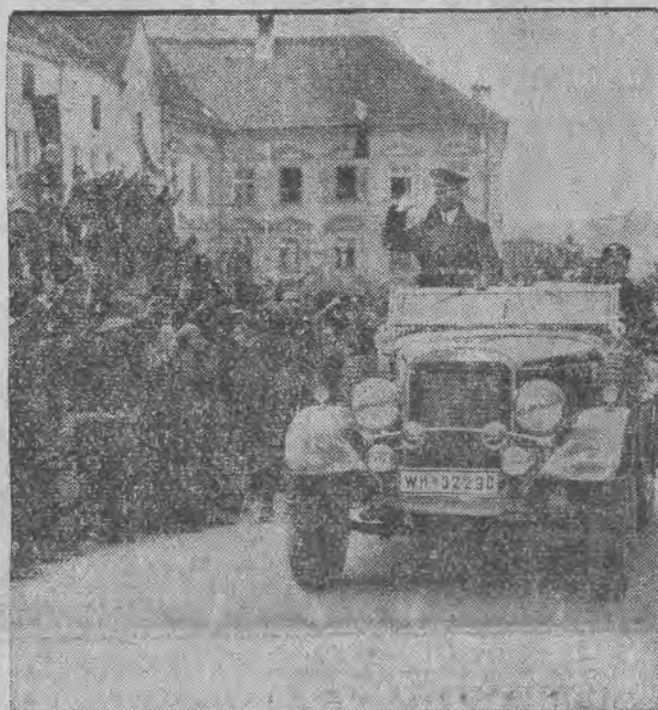
Hitler wjeżdża do swego rodzinnego miasta — Braunau tej przysięgi złamać. Składają ją dziś Niemcy od Królewca do Kolonii i od Hamburga do Wiednia.

Żadna groźba, żaden mus i żaden gwałt nie może