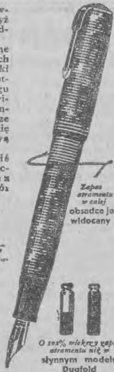
Zapewni atrament w całej obsłudze jest widoczny

Obejrzycie dziś jeszcze to modne, nowoczesne pióro w jednym z lepszych sklepów piór wiecznych.