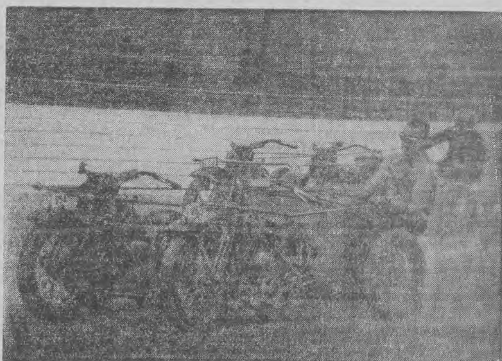
1. Rozbity wóz wyścigowy. Na zawodach automobilowych w Cork w Irlandii, nieszczęśliwemu wypadkowi uległ młody jeździec fabryczny Wakelield, który prowadził wóz marki Maserati — 2. Nowocześni gladiatorzy. Na święcie sportowym policji australijskiej zademonstrowano wyścigi nowoczesnych kwadryg, które widzimy powyżej