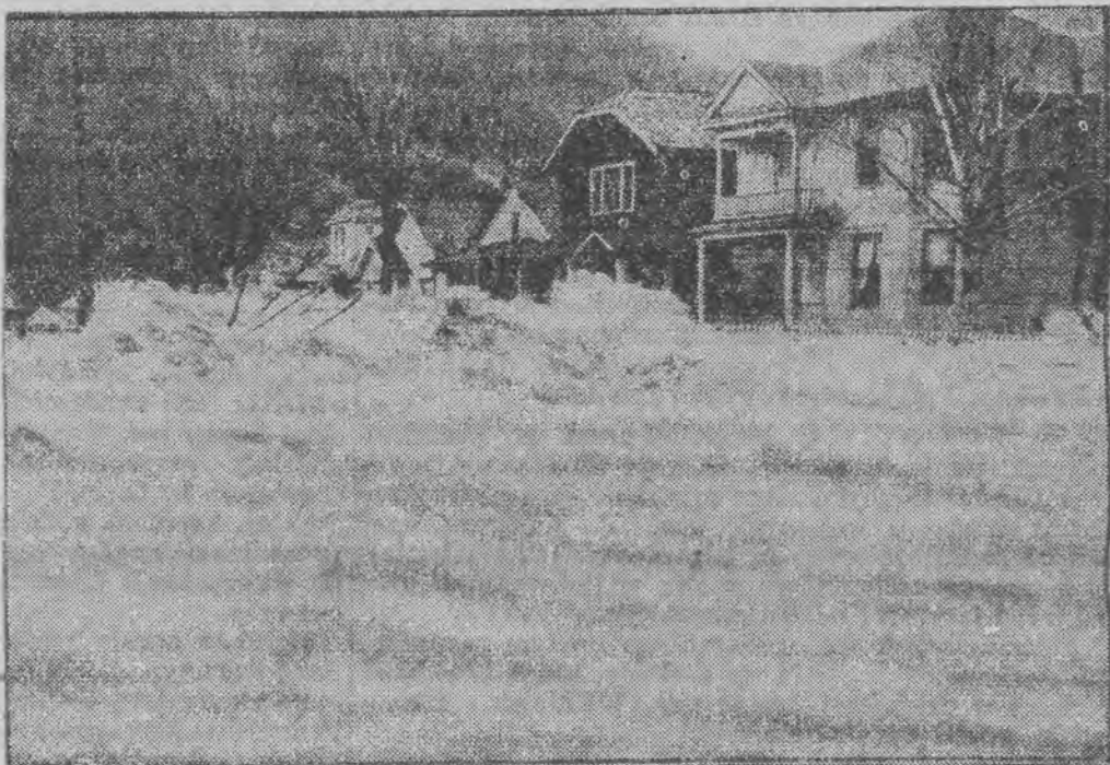
plyną szerokim strumieniem przez główną ulicę spokojnego miasteczka amerykańskiego w stanie Idaho