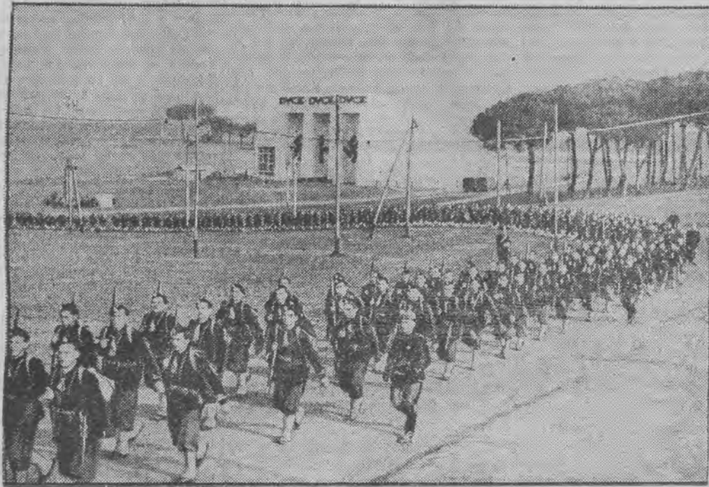
Przemarsz faszystowskich organizacji młodzieżowych

Wyjazd Ojca św. z Rzymu do letniej rezydencji Castel Gandolfo w dniu 30 ub. m. komentowany jest jako celowa demonstracja. Papież opuścił Rzym w przeddzień przyjazdu kanclerza Hitlera, aby usunąć w ten sposób grunt wszelkim plotkom na temat ewentualnej wizyty kanclerza Hitlera w Watykanie i zmanifestować swoją nieprzyjazną postawę wobec Trzeciej Rzeszy.