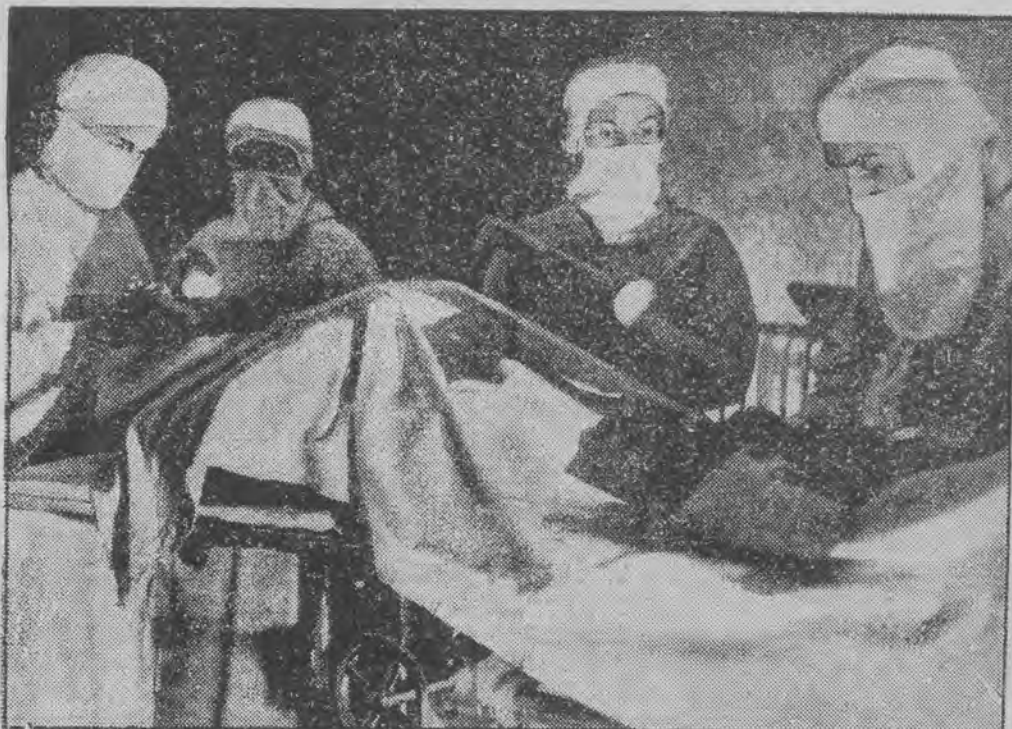
musiano w jednym ze szpitali w Lancashire (Anglia) dokonać operacji, ponieważ nagle zgłosił światło w całym miesiącu.