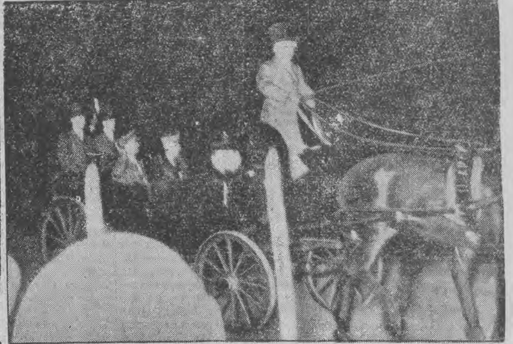
Mussolini wita Hitlera na dworcu w Ostii. Na lewo król Wiktor Emanuel. — Hitler w karocy królewskiej obok Wiktora Emanuela jedzie przez ulice Rzymu.