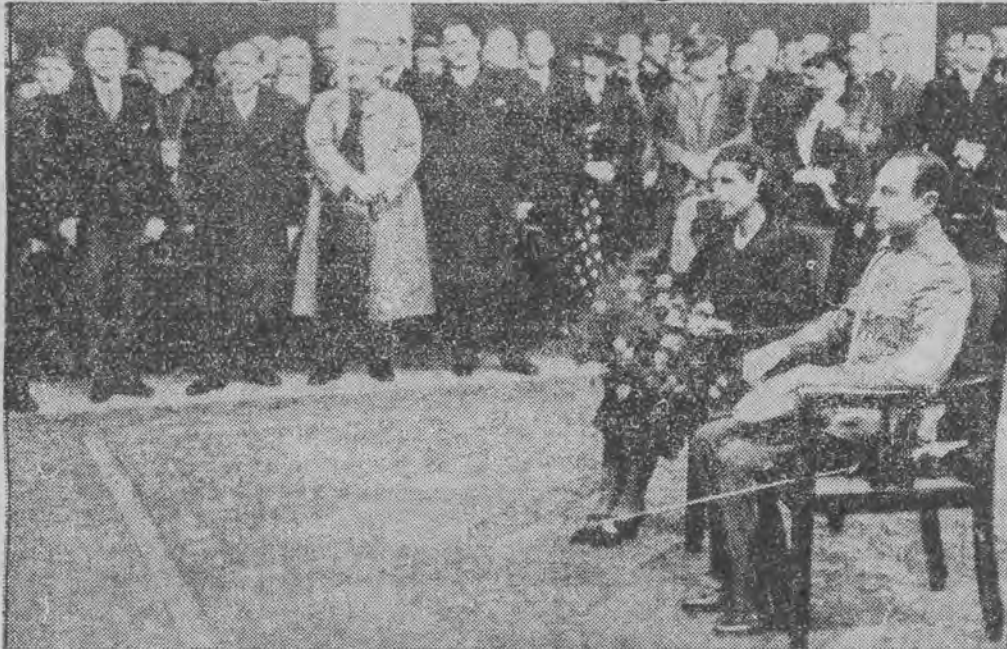
otwarte zostały uroczystie przez księcia Pawła. Obok siedzi księżna Olga. W głębi w pierwszym rzędzie stoją członkowie rządu jugosłowiańskiego.