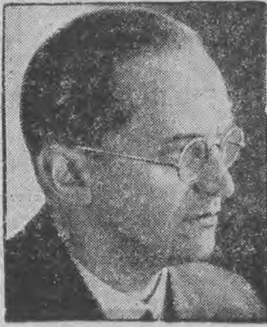
KONRAD HENLEIN przywódca Niemców sudeckich w Czechosłowacji.

Rolnikowi należy obniżyć podatki pieniężne, a umożliwić mu opłatę w naturze na rzecz bezrobotnych. W ten sposób za nasze podatki nie musiano by zakupywać naturalii dla naszych bezrobotnych od obconarodowego, odległego co do przestrzeni rolnictwa.