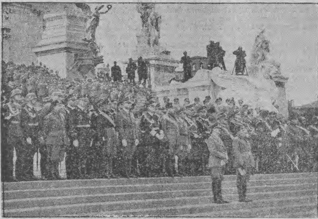
Kanclerz Rzeszy i Mussolini składają hołd Nieznanemu Żołnierzowi w Rzymie

ym, to jest pochodem w kostiu- mach, reprezentujących różne epoki i wybitne osobistości w historii Włoch. Pochód, zorganizowany zo- stał siłami karabinierów królew- skich. Widowisku przyglądało się 100-tysięczna publiczność.