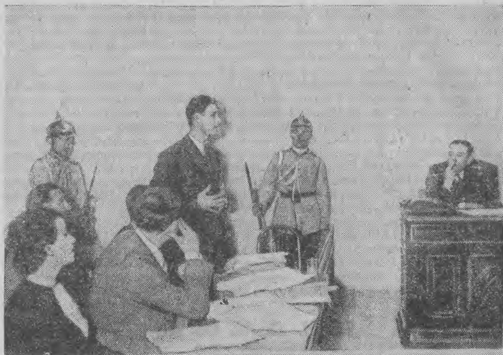
Codreanu broni się na procesie, który skończył się wyrokiem w wysokości 10 lat robót przymusowych.

Na temat przywódcy nacjonalistycznych wyrotowców rumuńskich, Zelea Codreanu, który w tych dniach skazany został na dziesięć lat robót przymusowych, pisano już wiele, a co do pochodzenia jego snuto najrozmaitsze domysły. Zanim rozpoczął się proces, którego przebieg śledzony był w Rumunii z ogromnym napięciem, władze przeprowadziły skrupulatne śledztwo, celem stwierdzenia faktycznego pochodzenia przywódcy naziśtów rumuńskich.