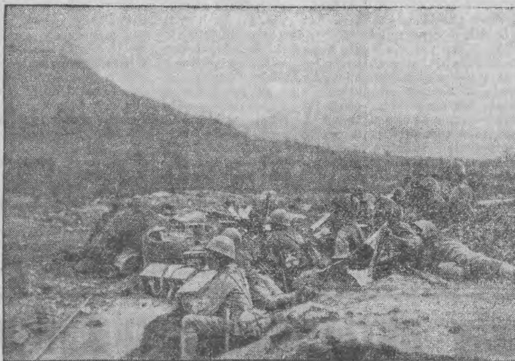
Wysunięte gniazdo karabinów maszynowych w skalistych górach na froncie Hsi - Czau w Chinach