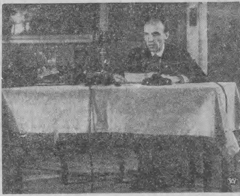
przed mikrofonem radiowym, pod czas wygłaszania przemówienia programowego do narodu węgierskiego.