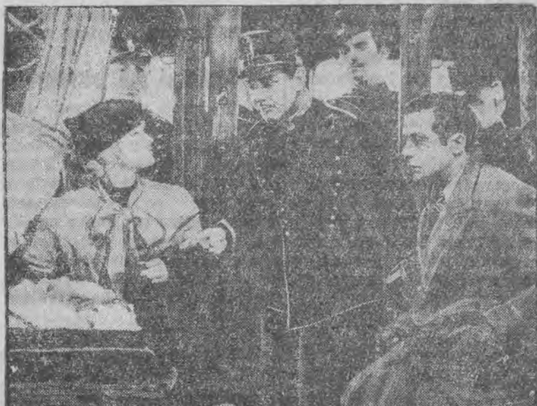
Anna Neagle i Fernand Gravet w szampańskiej komedii p. t. „Królestwo Zakochanych”.

Kino „Palace” występuje dziś z premierą filmu p. t. „Królestwo zakochanych”, perlącego się najprzedniejszym humorem, dowcipem i pikanterią.