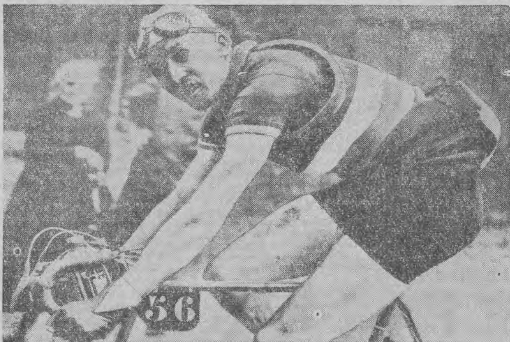
prowadzi w najpiękniejszym wyścigu świata „Tour de France“.