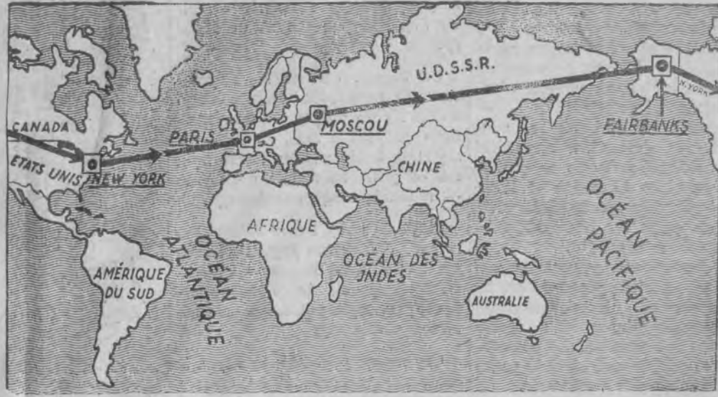
„Latający milioner“ Howard Hughes (pośrodku w kapeluszu) wraz z załogą, z którą odbywa re kordową podróż lotniczą naokoło świata. — Dokładna trasa lotu naokoło świata Howarda Hughesa z Nowego Jorku przez Atlantyk, Europę, Rosję, Alaskę i Kanadę do Nowego Jorku.

MOSKWA, 13 7. (PAT). — Hughes wylądował o godz. 10,08 w Jakucku.