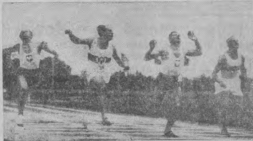
ZASŁONA (Polska) pokonał mistrza i rekordzistę Rzeszy Borchmeyera w czasie nowego rekordu 10.6.

samolotem ścignęli wielokrotnego mistrza i współrekordzistę Rzeszy Borchmeyera z Berlina. Borchmeyer rano zdawał egzamin na uniwersytecie berlińskim i w południe wyleciał do Królewca. Borchmeyer miał na 100 m. już 10,3, a na olimpiadzie w Berlinie był piąty.