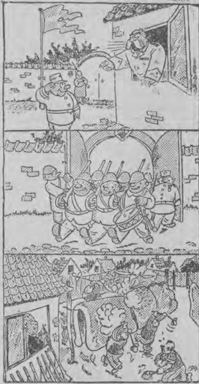
Letnie porządki u pułkownika