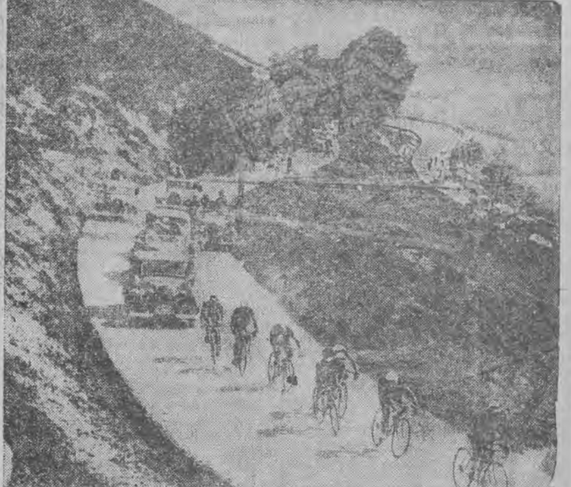
przewodziła trasa gigantycznego wyścigu „Tour de France“, który przyciąga świat sportowy.