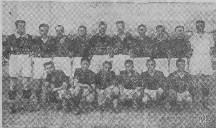
znakomity reprezentant jugosłowiańskiej piłki nożnej — najbliższy gość ŁKS-u.

dziesięć lat młodszych kolegów. Drużyna, która podejmuje podróż do Polski składa się z 19 zawodników, gdyż tournée prowadzi dalej do krajów nadbałtyckich. Wszystkie pozycje oprócz łączników i środkowego pomocnika posiadają dublowaną obsadę.