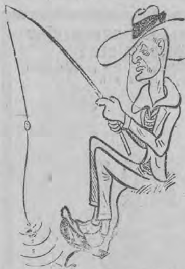
Premier Chamberlain w karykaturze.

Odnosnie układu angielsko - włoskiego, mówca oświadczył, że rząd brytyjski nie uważał tego układu wyłącznie jako porozumienie o charakterze dwustronnym, lecz jako przyczynek do ogólnego odprężenia w Europie. Rząd brytyjski sądzi, że sytuacja w Hiszpanii stanowi stałe zagrożenie pokoju europejskiego i dlatego też sytuacja ta powinna być wyjaśniona, zanim układ angielsko - włoski wejdzie w życie. Nie jest winą rządów brytyjskiego i włoskiego, że dotychczas nie zostało to dokonane. Włochy dotrzymały słowa, zmniejszając garnizony w Libii, zaprzestając propagandy antyangielskiej oraz współpracując w komitecie inter-