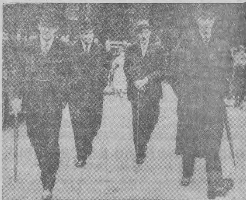
Od prawej ku lewej: angielski minister spraw zagranicznych lord Halifax, brytyjski ambasador w Berlinie Neville Henderson i kanclerz skarbu Simon, opuszczają Foreign Office w Londynie po konferencji, odbytej na temat sytuacji w Czechosłowacji.

Rewelacyjny puder nadaje cerze idealną matowość i świeży, młodzieńczy wygląd.