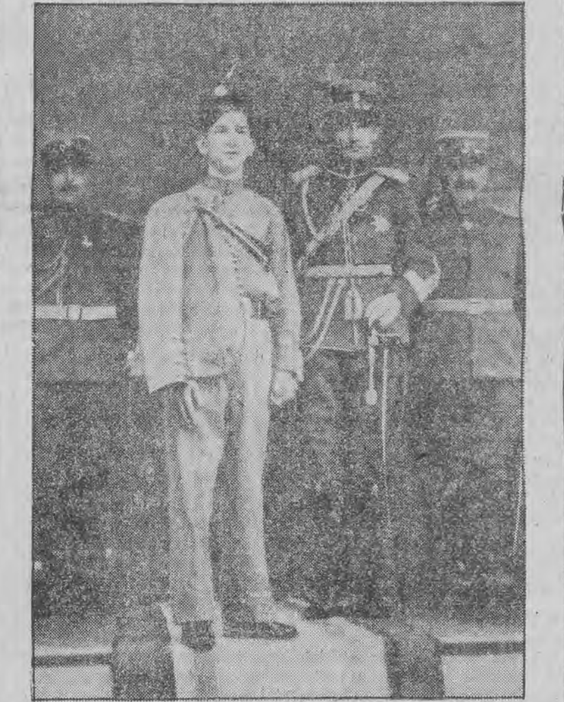
Młody król jugosłowiański Piotr II (w mundurze sokolskim) w towarzystwie swego wuja, regenta ks. Pawła.

Przy bólach głowy i zawrotach, wywołanych przez zaparcie stoła, należy używać wieczorem i rano na czczo pół szklanki naturalnej wody gorzkiej Franciszka - Jozefa. Zapyt. West. lek.