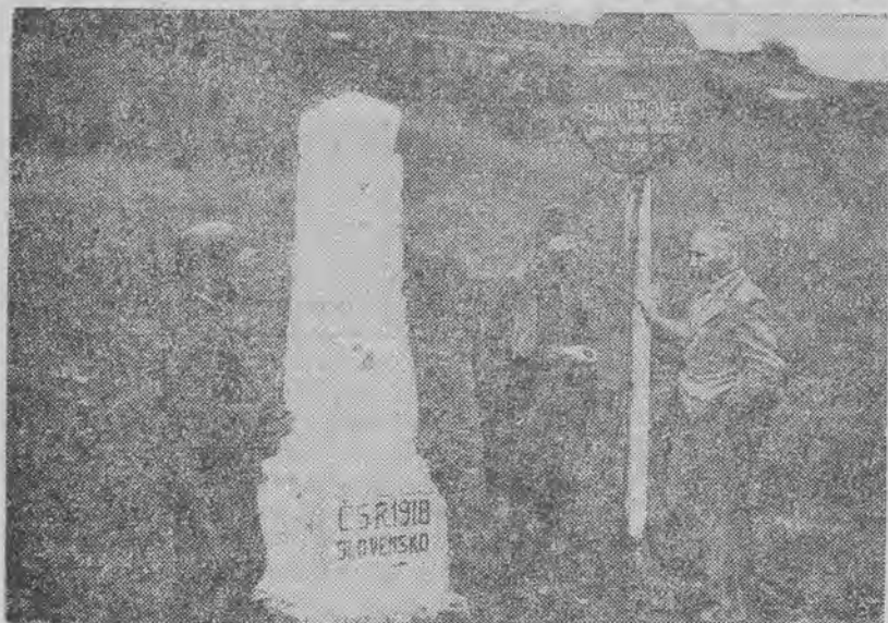
SLUP GRANICZNY CZESKI Z 1918 ROKU, t. j. jeszcze z okresu przed zajęciem przez Czechów Śląska Zaolzańskiego. Dziś wskutek sprawiedliwości dziejowej słup ten stanowi znowu granicę czeską.

KARWINA, 10.10. (Tel. wł.). — Karwina szalala wczoraj z radości! Plan wkroczenia wojsk polskich do Karwiny przewidywał wymarsz kolumn z linii demarkacyjnej o godz. 10 przed południem. Jeszcze o godzinie 9.30 ostatnie oddziały czeskie w pośpiechu opuszczały bogato przystrojone miasto.