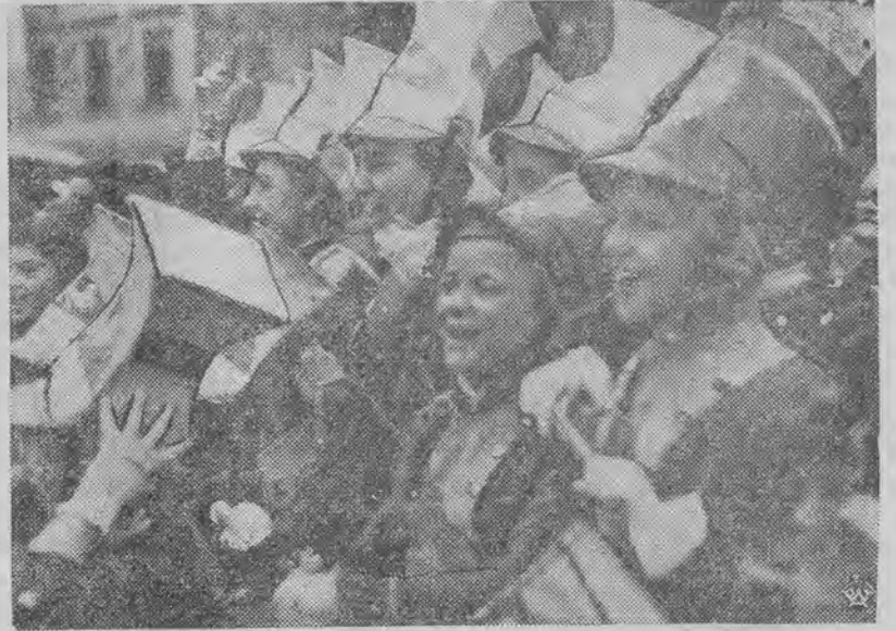
Na twarzach dziatwy polskiej we Frysztacie maluje się radość i szczęście.

Linie wytyczone, kwestie mniej zrozumiałe wyjaśniono, o- skich władz wojskowych jest przeżyciem niecodziennym. Na czele ciągnących wojsk jedzie sa- mochód wojskowy z białą chorągiewką z oficerami sztabowymi. Obserwujemy właśnie takie pertraktacje przedstawicieli pol- skich władz wojskowych z cze- skimi. Na przeciw polskiego sa- mochodu, chronionego neutral- ną chorągiewką, stoi samochód z czeskimi oficerami. Wszyscy są eleganccy, jak na galowe przyjęcie. Oficer czeski z mono- klem w oku rozpościera mapę okolicy. Rozjemcy podchodzą do mapy, pochylają się, zakre- ślają ołówkami linie, do których dziś dotrą oddziały polskich wojsk, a poza które cofną się dawni posiadacze tych ziem.