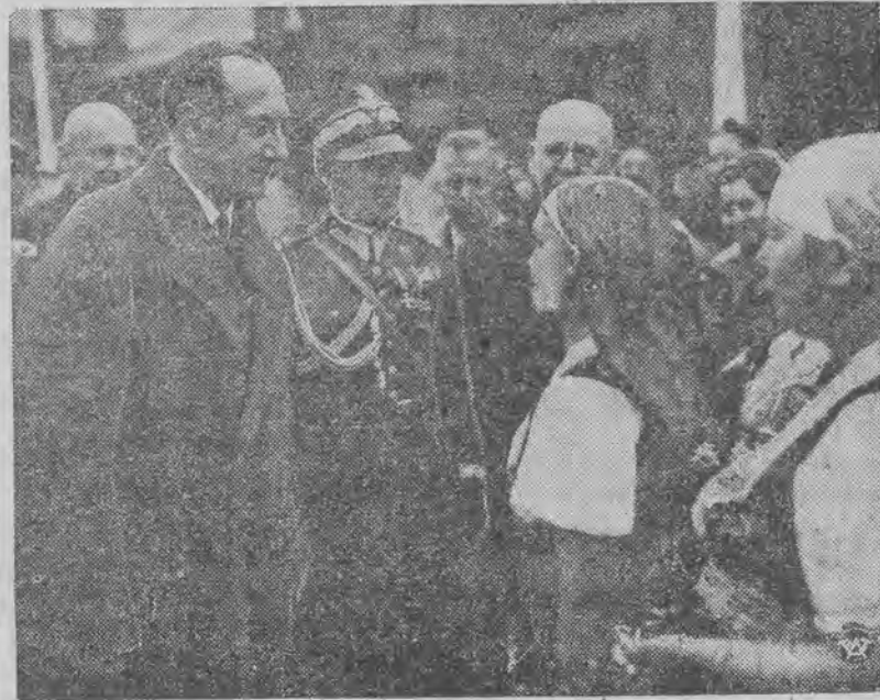
Minister Beck w towarzystwie gen. Bortnowskiego powitany przez kobiety śląskie.

W. RZYMOWSKI W ŁODZI. Staraniem Klubu Demokratycznego w Łodzi odbędzie się w niedzielę, dn. 16 b. m. o godz. 12-iej w sali Stow. Śpiew., przy ul. 11-go Listopada, od- czyt na b. aktualny temat: „Polska na tle obecnej sytuacji politycznej”, któ- ry wygłosi znany publicysta W. Rzy- mowski z Warszawy. Bilety są już do nabycia w przedsprzedaży w lokalu Klubu Demokratycznego w Łodzi, ul. Piotrkowska 105, w godzinach 19—21.