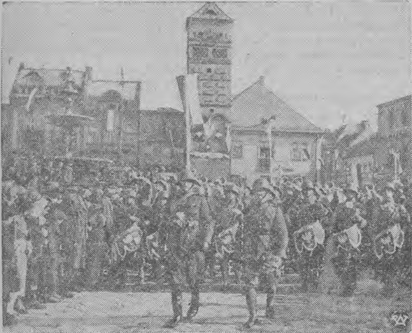
Wkroczenie wojsk polskich wśród entuzjazmu ludności na rynek frysztański

Jak zaimowaliśmy najstarsze miasto Zaolzia -- Frysztat