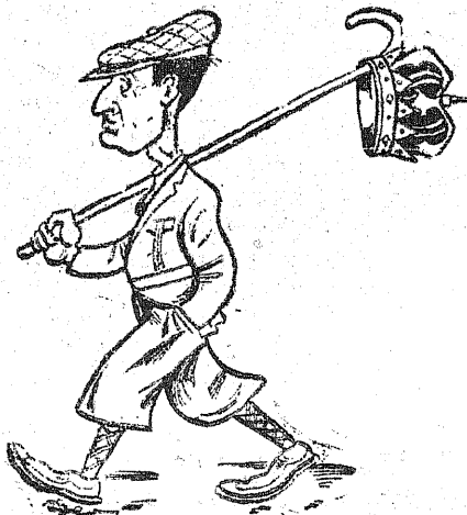
Król Alfons udaje się na wędrowkę

składa się głównie z starczki ciężkich kruszców, szczególnie żelaza. Druga jej część składa się głównie z związków krzemionów z nie wielką przymieszką kwasu krzemieniowego. Wierzchnia zaś warstwa składa się z krzemienia z domieszką kwarcu.