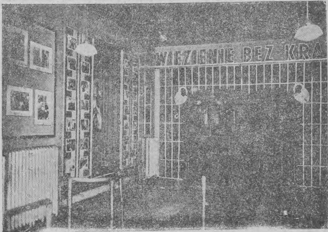
Niezwykłe efektowna dekoracja poczekalni kina „Casino” w Łodzi, do filmu „Wieżenie bez krat”.

Dzisiejsza premiera w kinie „Casino” ściąganie wszystkich kinomanów Łodzi. Dziś w kinie „Casino” święto sztuki filmowej: „Wieżenie bez krat”!