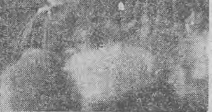
Przed sądem karnym w Paryżu stanęła grupa przywódców wielkiego strajku w zakładach samochodowych Renaulta.

Rząd, jak się wydaje, zamierza skorzystać z obecnej sytuacji, by doprowadzić do ostatecznego oczyszczenia głównych portów północnych Francji z agitatorów politycznych, a przede wszystkim do oczyszczenia z elementu wywoławczego wielkich kompanii żeglownych, które w ostatnim stuleciu były widownią wielu strajków, szkodziących wybitnie prestiżowi francuskich linii okrętowych i ułatwiających konkurencję liniom zagranicznym.