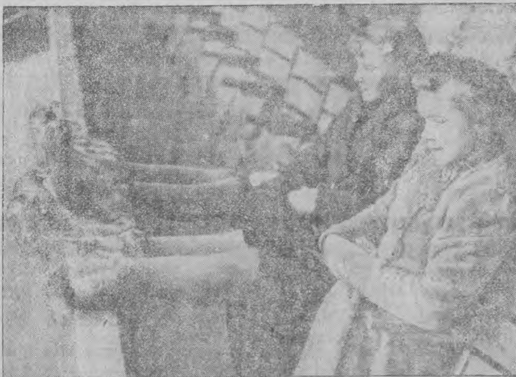
W Szwecji wprowadzono nową modę dla łyżwiarek, mianowicie fu trzane buty, które nakłada się w czasie odpoczynku między jedną jazdą na lodzie a drugą.