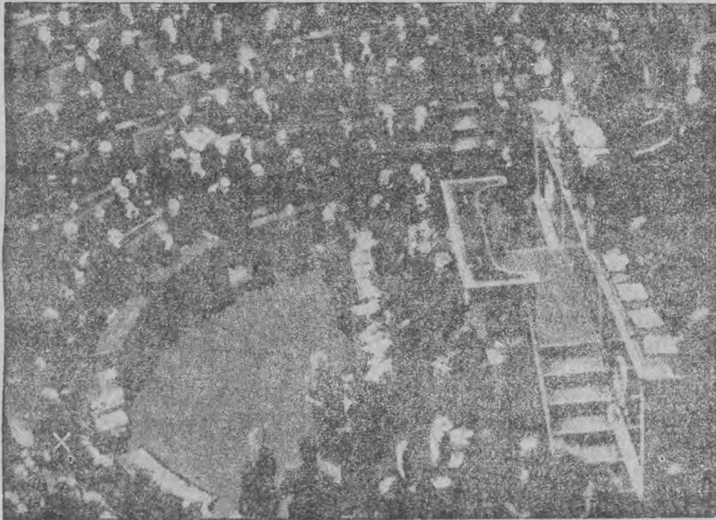
Izba francuska debatuje nad polityką Daladiera.

Dwudniowe obrady komisji redakcyjnej nie przyniosły oczekiwanych rezultatów. Rozbieżności między dwiema koncepcjami były tak wielkie, że nie dało się doprowadzić uchwalenia wspólnej rezolucji kompromisowej. Ostatecznie w głosowaniu w łonie komisji redakcyjnej okazało się, iż za wnioskiem Bluma opowiedziało się 18 głosów, za wnioskiem Paul Faure'a 11 głosów, zaś czterech delegatów powstrzymało się od głosowania. Wobec powyższego rozbitcia, postanowiono decyzję przekazać plenum kongresu.