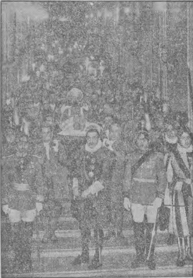
Uroczysty kondukt żałobny z doczesnymi szczątkami zmarłego Papieża Piusa XI przechodzi z kaplicy Sykstyńskiej do bazyliki św. Piotra.

Smiertelne szczątki w trzech trumnach złożono obok sarkofagu Piusa X