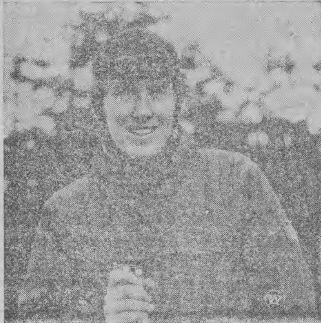
Christl Cranz (Niemcy) wygrała bez apelacyjnie bieg zjazdowy i niewątpliwie wygra dziś slalom.

— Co pan chce wiedzieć? Wiele lat mam, co robię, a może też wiele ważyć? Niech pan notuje, aby nie pomylić lat z wagą. Urodziłam się... 1 czerwca 1914 r., w... Brukseli skończyłam więc niezadługo 25 lat. Mając 9