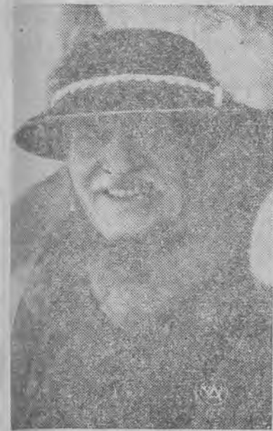
Pan Prezydent Rzeczypospolitej prof. Ignacy Mościcki w Zakopanem