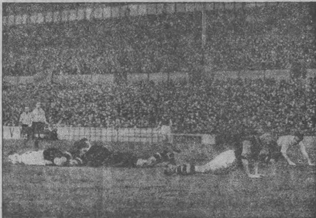
WSPANIAŁY MOMENT Z MECZU PIŁKARSKIEGO. Oczywiście „coś podobnego” zobaczyć można na boiskach angielskich.