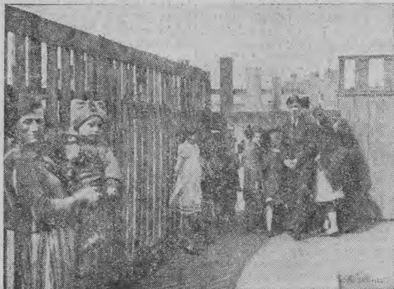
Miejsce przy zbiegu ulic Pałacowej i Krawieckiej, gdzie natrafiono na pierwszy ślad zbrodni. Za parkanem widocznym na lewo, leżał worek z nogą i wnętrznościami ludzkimi. Przy parkanie nawprost wiodła droga sprawcy obydnej zbrodni.

Przez blisko dwie godziny prowadzone były poszukiwania, które ograniczone zostały pomyślnym wykopaniem, bowiem jeden z wywiadowców na pochyłości zsyrowiska, tuż u jego wylotu, znalazł odciętą od ramienia rękę ludzką. W odległości dwóch metrów, nieco niżej, znaleziono wypełniony worek, którego wydobyto kadłub ludzki