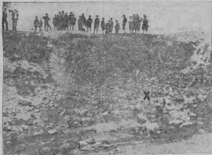
Widok na zsyrowisko. X oznacza miejsce, w którym znaleziono worek, zawierający kadłub ludzki, wnętrzności i nogę. Nieco wyżej leżała oddzielnie ręka z obrączką na palcu.

W drugim worku między częściami ubrania znaleziono sznurek, co wskazywałoby, że kobieta najprawdopodobniej po zamordowaniu, została powieszona, by łatwiej można ją było ćwiartować, przy czym