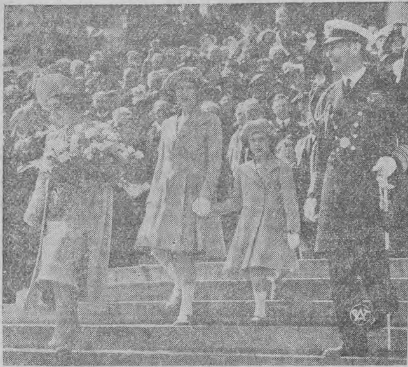
Uroczyste pożegnanie brytyjskiej pary królewskiej.

Na początku wojny światowej wysłano go w misji specjalnej do Francji, gdzie przydzielony zo-