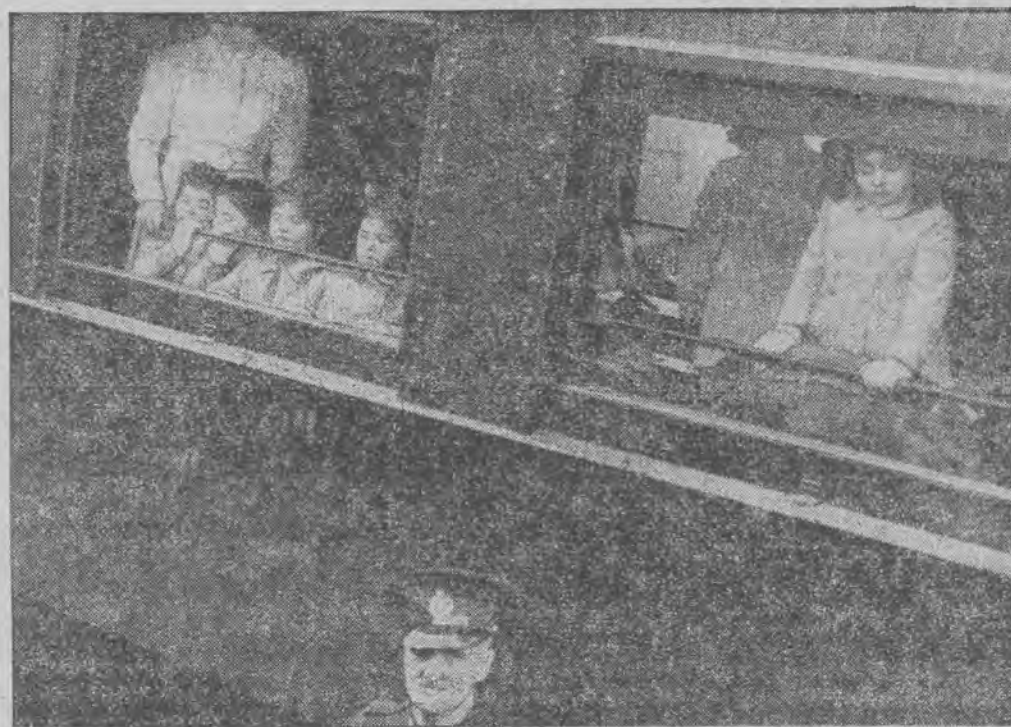
Pięciorazki Kanadyjskie przybywa ją specjalnym pociągami do Toronto, aby być przedstawione parze królewskiej.

Dane statystyczne, dotyczące działalności towarzystw ubezpieczeniowych, są nam nieraz bardzo dokładny obraz rozwoju sytuacji w poszczególnych dziedzinach życia gospodarczego. Jednym z charakterystycznych przykładów jest dział ubezpieczeń samochodowych (Auto - Casco). Rozwój tego działu idzie zgodnie w parze z rozwojem motoryzacji. Otóż, według porównawczych danych, zebranych z prywatnych zakładów ubezpieczeń, była w roku 1938 bardzo znaczna, wynosiła bowiem 86,6% sumy zebranych składek. Nasuwa się więc prosty wniosek, że ubezpieczenia samochodów dają duże korzyści właścicielom, którzy specjalnie w naszych warunkach drogowych wystawieni są na większe ryzyko niż gdzieindziej.