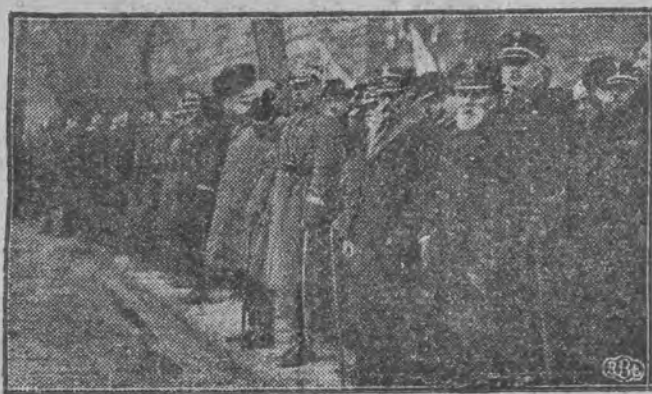
Wojewoda Jaszczolt i gen. Małachowski w otoczeniu wyższych oficerów i weteranów na defiladzie oddziałów garnizonu łódzkiego i przysposobienia wojskowego.

Jak było do przewidzenia — Łódź godnie uczciła dzień imienin marszałka Piłsudskiego. Od dawna czynione przygotowania spowodowały, że uroczystość ta wypadła okazale, budząc wszędzie żywe zainteresowanie mieszkańców osobą marszałka Piłsudskiego.