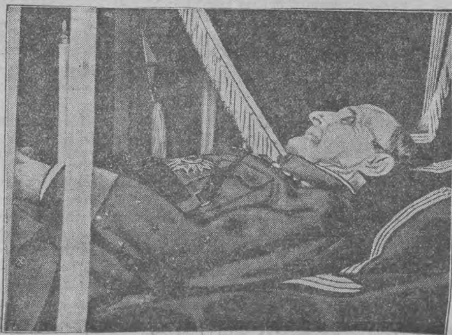
Marszałek Foch na łożu śmierci