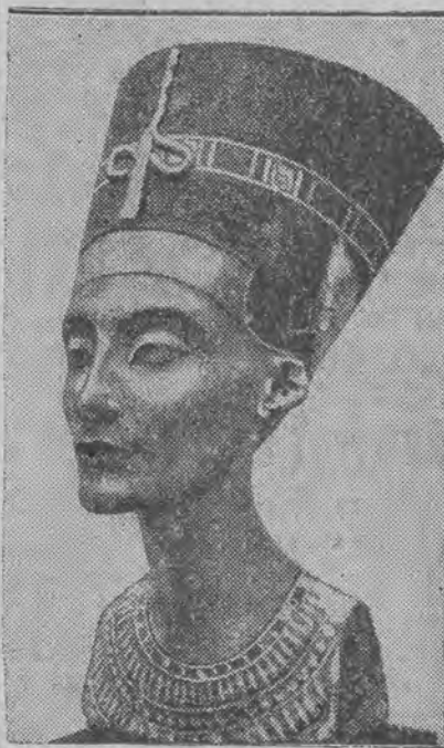
Znakomite dzieło sztuki staroegipskiej.