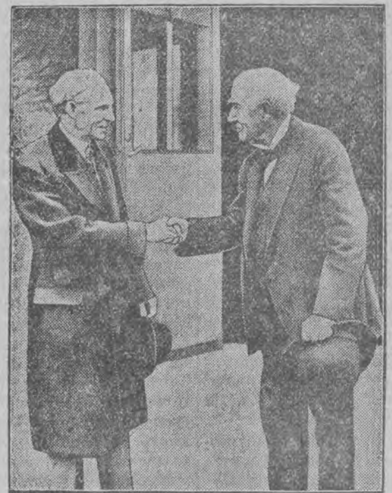
jadą do Europy: Henryk Ford, król automobilów i Tomasz Edison, król wynalazców.