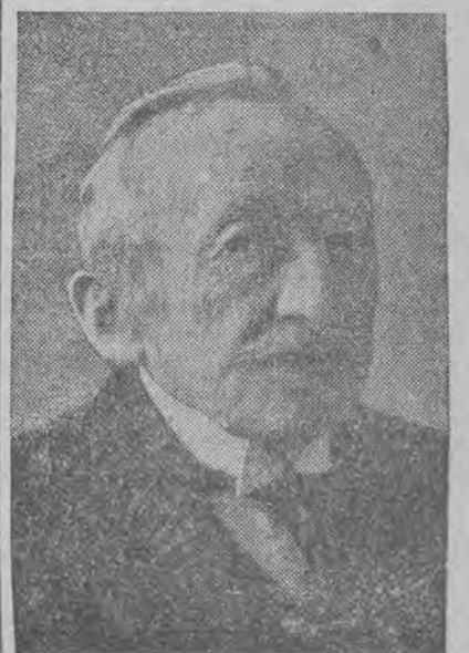
Zmarły długoletni wiceprezydent Krakowa.