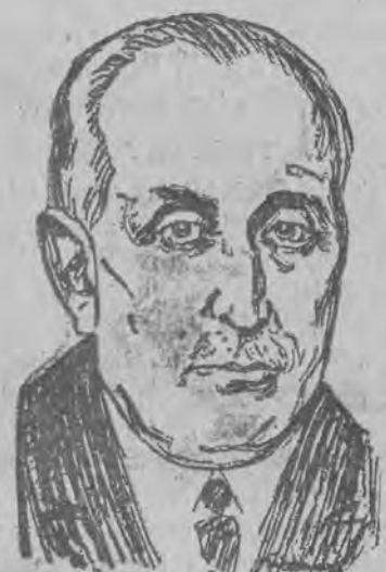
admirala de Magaz i

W książce tej znajdują się same złote prawdy; można je też z powodzeniem odwrócić.