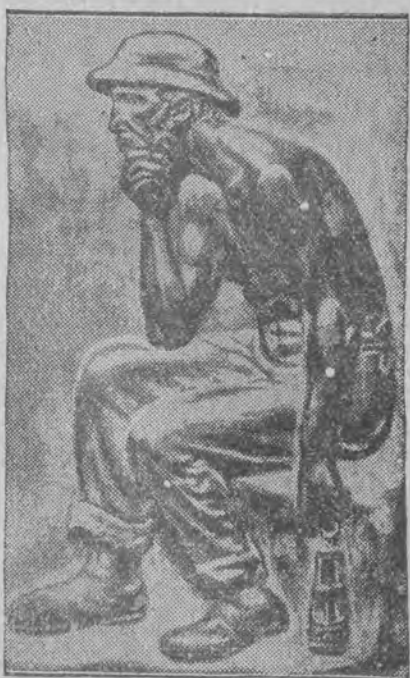
Słynna rzeźba rzeźbiarza Wilhelma Lehmbrücka.

Oddział aprowizacyjny przy urzędzie wojewódzkim przeprowadził lustrację młynów na całym terenie województwa, przy czem pociągnięto do odpowiedzialności cały szereg młynarzy za przekroczenie przepisów, jak również skonfiskowano w dniu wczorajszym 30.300 kilogramów mąki żytniej z wymiaru nieprzepisowego.