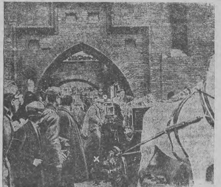
Ilustracja z roku 1923 przedstawiająca marsz. Focha w Krakowie. W głębi gen. Szeptycki na koniu.

FILHARMONJA TEATR ŻYDOWSKI Dziś, o godz. 9.30 wiecz.