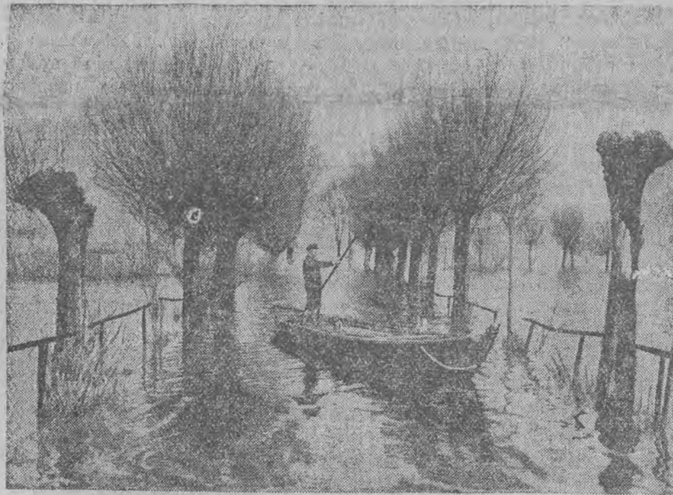
Na podmiejskich szosach z powodu wylewu rzek komunikacja utrzymywana jest za pomocą łodzi

W ostatniej chwili dowiadujemy się, że pod Modlinem utworzył się nowy zator, wskutek czego Wisła pod Warszawą z powrotem spiętrza się. O godzinie 11.30 stan wody na Wiśle pod mostem Kierbedzia doszedł już do 4.15 m., podczas gdy o północy wynosił 4.38. Niżina łomiankowska znajduje się z powrotem w groźnym położeniu, albowiem woda poprzez poprzerywane wały z powrotem przelewa się.