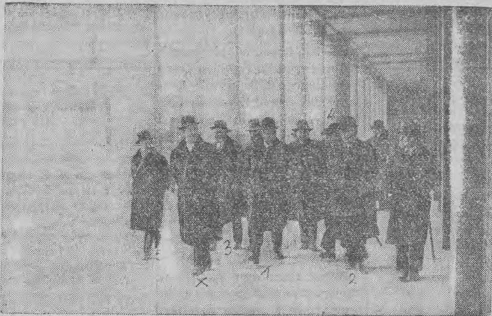
przed paru dniami zapoznał się ze stanem robót przy budowie Powszechnej Wystawy Krajowej.