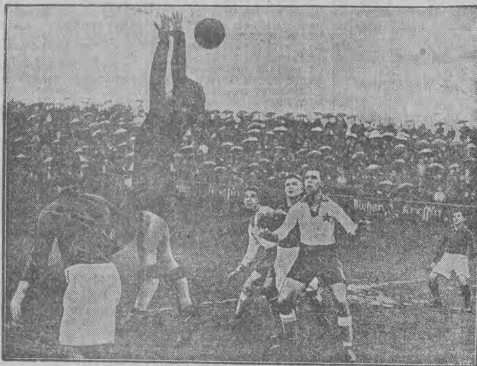
Mecz Nordwest'u z szwajcarską drużyną w Berlinie skończył się porażką gości.