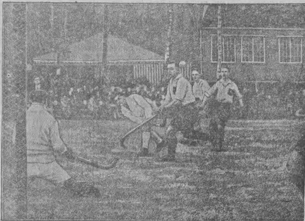
Zawody te rozegrane w Pradze zakończyły się zwycięstwem gospodarzy w stosunku 4:1.