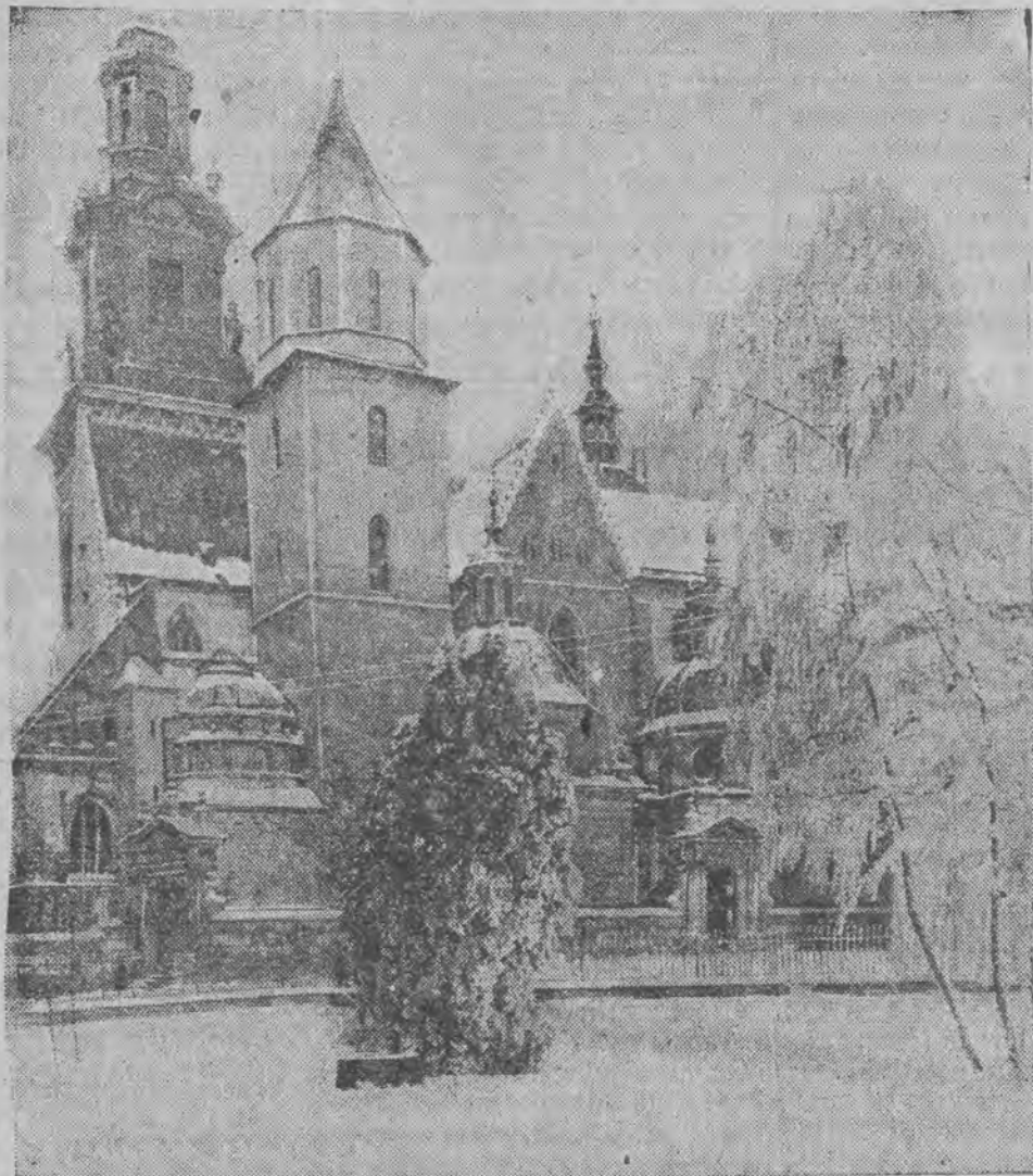
Widok Wawelu w kwietniu pamiętnego 1929 roku.