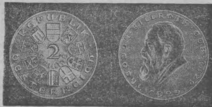
Z okazji 100-letniej rocznicy urodzin największego chirurga wszystkich czasów Teodora Billrotha, wybito w Austrii monety dwuszylingowe z podobizną jubilat.