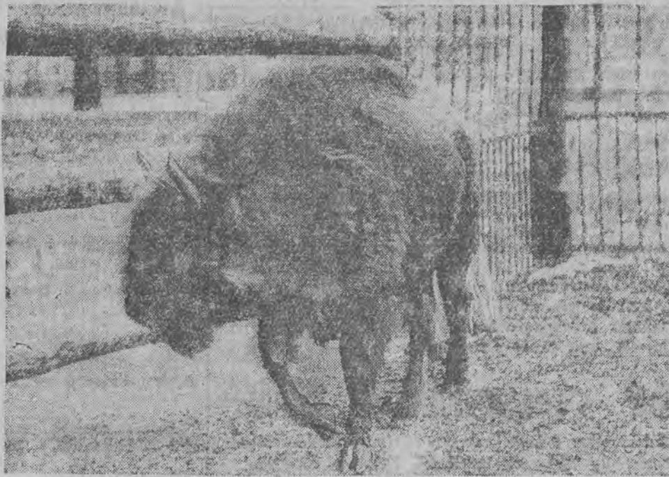
Sprowadzono do Warszawy 4 żubry dla warszawskiego ogrodu zoologicznego. Zdjęcie przedstawia żubra na nowym locum.