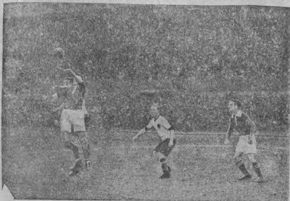
między Herthą a Tennis-Borussią zakończył się zwycięstwem Herthy w stosunku 1:0