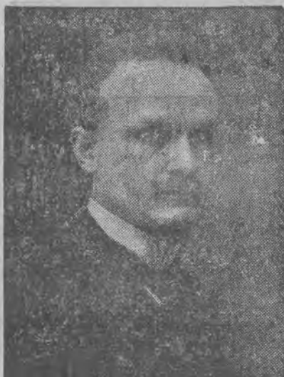
DR. TOMASZ LULEK, prawa skarbowego i rachunkowości państw. na Uniwersytecie Jagiellońskim, autor prac: „W sprawie kolei na Swięcie” (1903), „Organizacja obrony ziemi” (1916), „Polityczne warunki pracy gospodarczej w Królestwie Kongresowym” (1918), „Sprawa walutowa w Polsce” (1919), „Główne zagadnienia polityki handlowej w Polsce” (1921), „Teoretyczne podstawy rachunkowości kniepskiej” (1923).