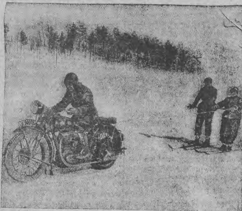
Nie w St. Moritz — ale we Lwowie w czasie ostatnich dni zimowych