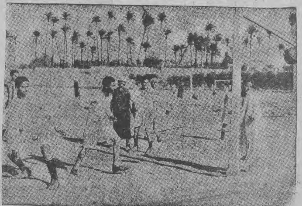
Trening ucz. w jednej z drużyn egipskich szkół średnich